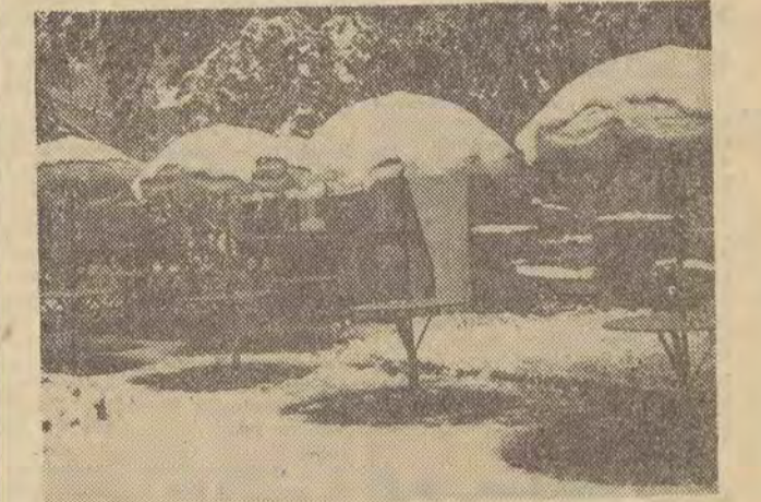
NA ZDJĘCIU: parasole słoneczne w kawiarnianym ogródku Zakopanego, smętnie stoją pod warstwą śniegu.

Fala gwałtownego ochłodzenia, opadów deszczu, a w górach śniegu, zatrzymuje w dalszym ciągu wczasowiczów i turystów w domach i schroniskach. Zmarznięci urlopowicze masowo garną się do pieców i kaloryferów, a także gromadzą się w kawiarniach i świetlicach. „Powrót zimy” szczególnie dotkliwie dał się we znaki wczasowiczom w górach. Na tomiast na północy kraju — na Wybrzeżu Gdańskim i Szczecińskim — 31 maja wreszcie zaświeciło słońce.