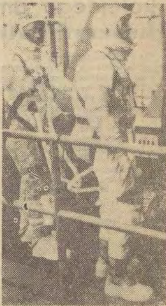
Na zdjęciu: astronauci T. P. Stafford (z prawej) i E. A. Cernan czekają na dzwigniki, które wyniesie ich na szczyt rakiety „Titan-2”, gdzie znajdują się ich polazd kosmiczny.

aby zbiegła się ona w odpowiednim punkcie przestrzeni z orbitą ATDA i aby oba obiekty znalazły się koło siebie. Drugi kosmonauta, Cernan, pomagał Staffordowi, obsługując pokładową elektronikę na maszynie cyfrową i aparat radarowy, który mierzył odległość do satelity.