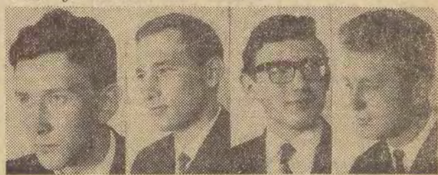
Pozostali podejmą po wakacjach pracę w zakładach. O miejsca nie muszą się troszczyć, zapotrzebowanie na fachowców jest bowiem olbrzymie. W br. Technikum Energetyczne przyjęło do klas pierwszych 120 nowych uczniów. (wit)

Gratulujemy sukcesu! Warto nadmienić, że wszyscy wyróżnieni ubiegają się o przyjęcie na Politechnikę Łódzką. Wyższe studia zamierza kontynuować około 30 proc. uczniów technikum. Poza tym wielu z nich wstępuje do szkół oficerskich.