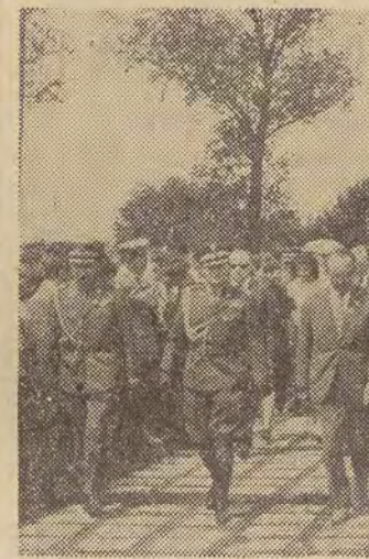
Przed frontem kompanii Wojska Polskiego.

Na sesję Światowej Rady Pokoju, która rozpocznie się w poniedziałek 13 czerwca w Genewie, radziecki Komitet Obronców Pokoju wysłał delegację pod przewodnictwem Aleksandra Korniejczuka, członka Prezydium SRP. W skład delegacji wchodzi m. in. pisarze: Borys Polewoj, Nikołaj Tichonow, Ilija Erenburg oraz metropolita Krużycki i Kolomieński.