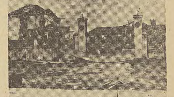
Bombowce amerykańskie podczas rajdów nad terytorium DRW nie omijają nawet obiektów cywilnych, osiedli, szpitali i świątyn. Na zdjęciu: zombardowany szpital w prowincji Thanh Hoa.

transportowe i handlowe oraz urzędy mają opracować własne plany ewakuacyjne. Tymczasem, trwają walki w południowym Wietnamie. Żołnierze amerykańskiej piechoty morskiej walczyli ostatnio z oddziałem partyzantkim na południe od Da Nang. Bój był tak zacięty, że Amerykanie musieli sromowadzić posiłki i korzystać z silnego wsparcia artylerii. Siły narodo-wo-wyzwoleńcze południowego Wietnamu — jak stwierdziła VNA — podczas ataku na jednostkę pancerną Amerykanów zniszczyły 30 czerwcza 43 pojazdy wojskowe, zginęło 300 żołnierzy amerykańskich.