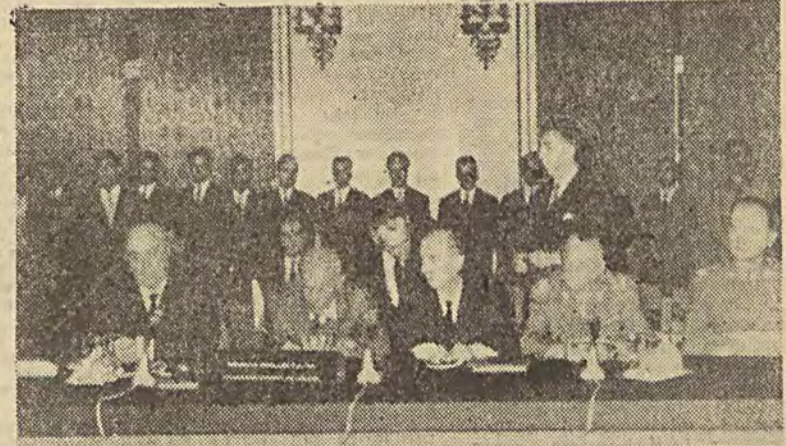
Władysław Gomułka podpisuje deklarację Doradczego Komitetu Politycznego Państw — Stron Układu Warszawskiego w sprawie agresji USA w Wietnamie. Z lewej premier Józef Cyrankiewicz. Od prawej siedzą: gen. Jaruzelski, marszałek Marian Spychalski i Zenon Kliszko.

Po wszechstronnym rozważeniu obecnej sytuacji w Europie i podstawowych czynników określających jej rozwój, państwa reprezentowane na naradzie doszły do wniosku, że w Europie, której niemal połowę stanowią państwa socjalistyczne, istnieje możliwość zapobieżenia niepożądanemu rozwojowi wydarzeń. Wspólnym wysiłkiem państw europejskich, wszystkich sił społecznych, działających na rzecz pokoju — nie-