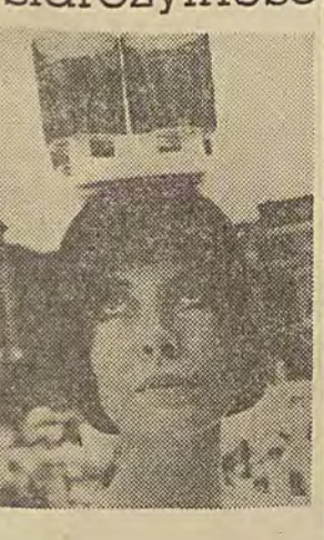
W dawnych czasach kobie- ty nosiły na głowie dzbany z wodą - modna paryżanka ma na kapeluszu taczkę z czte- rema szklankami whisky...