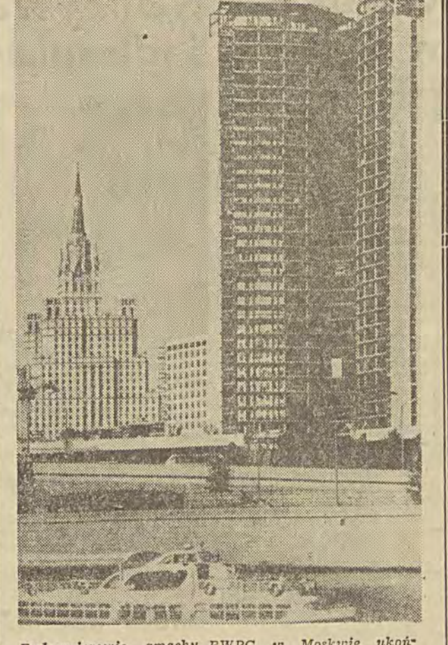
Budowniczo gmachu RWPG w Moskwie ukoń- czyli już ostatnie, 31 piętro wieżowca. Na zdjęciu: widok wieżowca przy Alei Kalinina. Na pierwszym planie rzeka Moskwa.