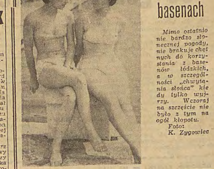
...i na basenach

Pełną parą idą roboty ziemne przy budowie wiaduktu na Chojnach. Wczoraj rozpoczęto wydłużanie wykopu ul. Rzgowskiej w stronę ul. Malczewskiego. Po drugiej stronie torów układa się już betonowy podkład pod nawierzchnię.