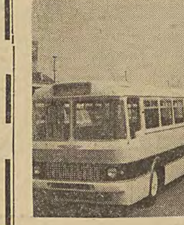
Nowa propozycja Węgrów dla Polaków: „Ikarus 556”. Pneu-matyczna amortyzacja, oddzielna kabina kierowcy, motor umieszczony pod podłogą.

via. A to, co się powtarza z dnia na dzień, staje się po prostu niezauważalne. Daleki jestem, oczywiście, od tego, aby pomniejszać czy negować czyny bohaterki. Do dziś nie mogę zapomnieć owego milicjanta, który z narazem własnego życia wyratował we wrocławskim ZOO chłopczyka przed niedźwiedziami. Był to czyn wspaniały, wymagający nie lada odwagi. W tym, co piszę, chce się jedynie upomnieć o tych ludzi, którzy cierpliwie, z samozaparciem i oddaniem, wkładają całego siebie w swoją pracę, a nie są zauważani i nagradzani. „Mnie nie do tego, tylko to mówię, aby była nagroda równa zasłudze” — powtórzę na zakończenie za Stanisławem Orzechowskim (tym z szesnastego wieku).