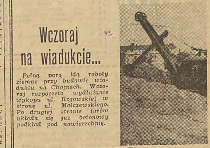
Wczoraj na wiadukcie...

Pełną parą idą roboty ziemne przy budowie wiaduktu na Chojnach. Wczoraj rozpoczęto wydłużanie wykopu ul. Rzgowskiej w stronę ul. Malczewskiego. Po drugiej stronie torów układa się już betonowy podkład pod nawierzchnię.