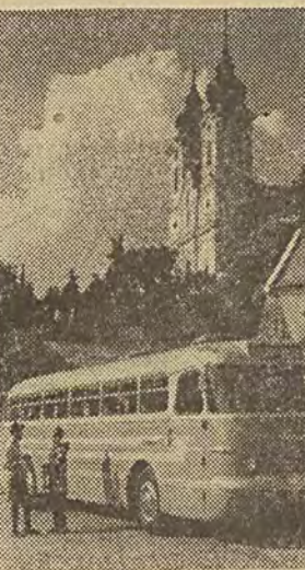
„Ikarus-Lux”: luksusowy 32-miejscowy autobus dalekobieżny, lotnicze fotole, buiet z 10 dółką (1). Sztybkość 101 km na godzinę.

dla waszych miast w godzinach „szczytu”: zaledwie 10,3 m długości, 3 pary drzwi, tylko 21 miejsc siedzących, a poza tym zmieści się w nim bez liku pasażerów!