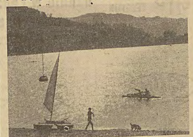
Pięknie położone na tle górskiego krajobrazu Jezioro Rożnowskie cieszy się dużym powodzeniem wśród urlopowiczów z całego kraju. Przy zaporze powstała nowoczesna kolonia mieszkaniowa, a w okolicy Tegoborza nowe schronisko PTT-K. Jezioro Rożnowskie coraz lepiej zagospodarowane turystycznie, daje szerokie możliwości uprawiania sportów wodnych, a piękne okolice zachęcają do wycieczek.