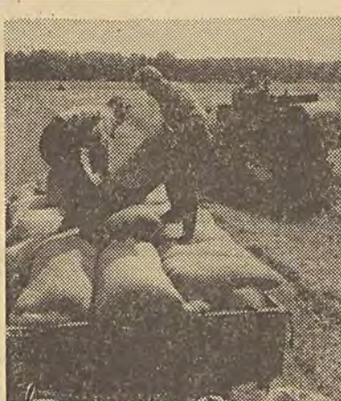
Wzrost z kombajnu ziarno wędruje do suszaralni.

Na podstawie wtorkowych meldunków korespondentów terenowych PAP można sobie uzmysłowić, jaki taki obraz aktualnej sytuacji żniwnej.