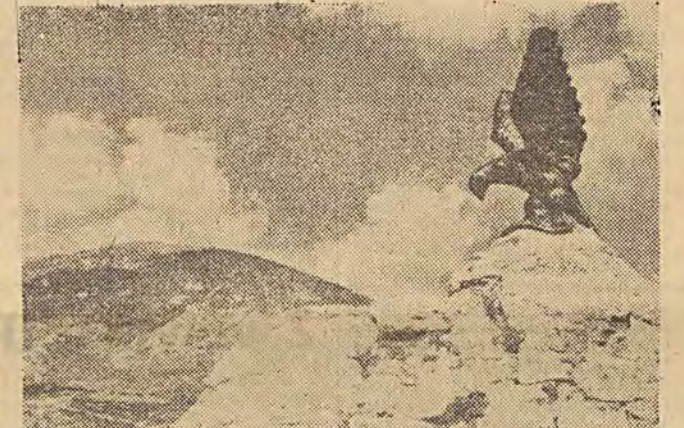
Symbolem Piatigorska jest orzeł, czuwający nad miastem i nad jednym z okolicznych wzgórz.

Do Piatigorska dotarliśmy o północy. Wiatry nas różnokolorowe neony i smugi reflektorów oświetlają cichą i ciekawie zabytki tego malowniczo położonego na stokach góry Maszkę uzdrowiska, przypominającego trochę naszą Krynicy - Zdrój.