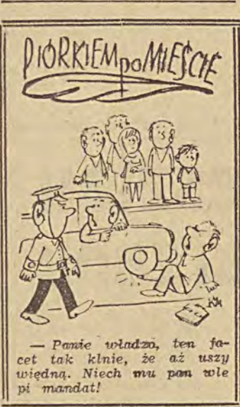
Pani widać, ten facet tak kłnie, że aż uszy widać. Niech mu ponieść mandat!

Jeśli chodzi o odzież szkolną, można przyjąć, że zaopatrzenie jest dobre. Są mundurki szkolne, spodnie i bluzy chłopięce, fartuchy, spódnice, bluzki i spora ilość tkanin szkolnych. Brak jedynie spódnic z elasty, praktycznych i w „Strojnis” przy ul. Piotrkowskiej 288/90 pokupnych worków na pantofle z tkaniny fartuchowej. Największy wybór towarów, zwłaszcza odzieży dla chłopców, posiada sklep przy ul. Zgierskiej 11.