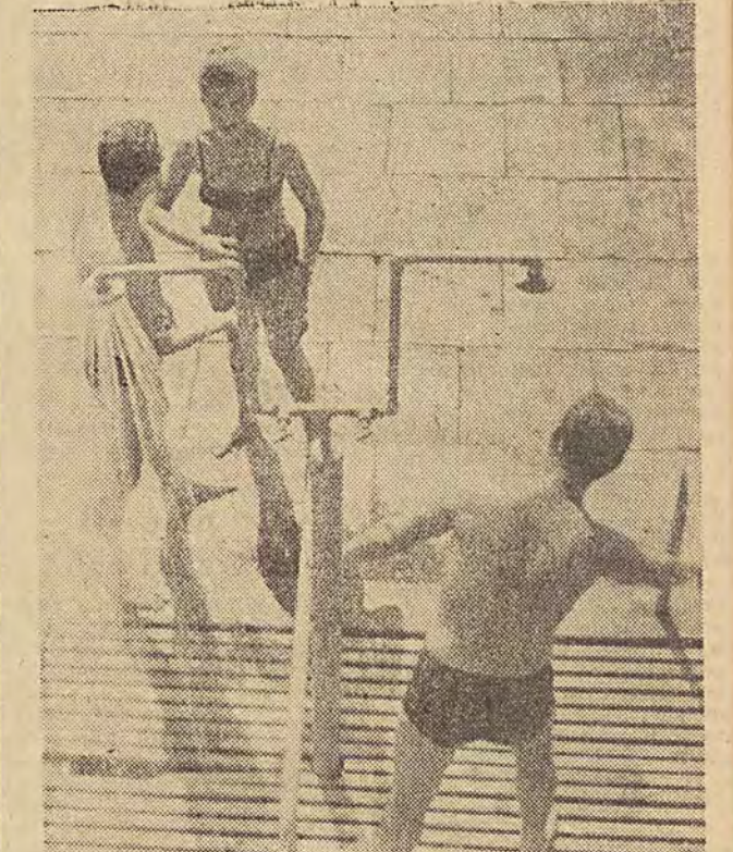
Największym powodzeniem cieszyły się kąpieliska, baseny i... chłodny prysznic.

☆ Tysiące łódzian w parkach i poza miastem ☆ W pogotowiu - trzyporażenia słoneczne ☆ Omdlenia w pociągach i tramwajach