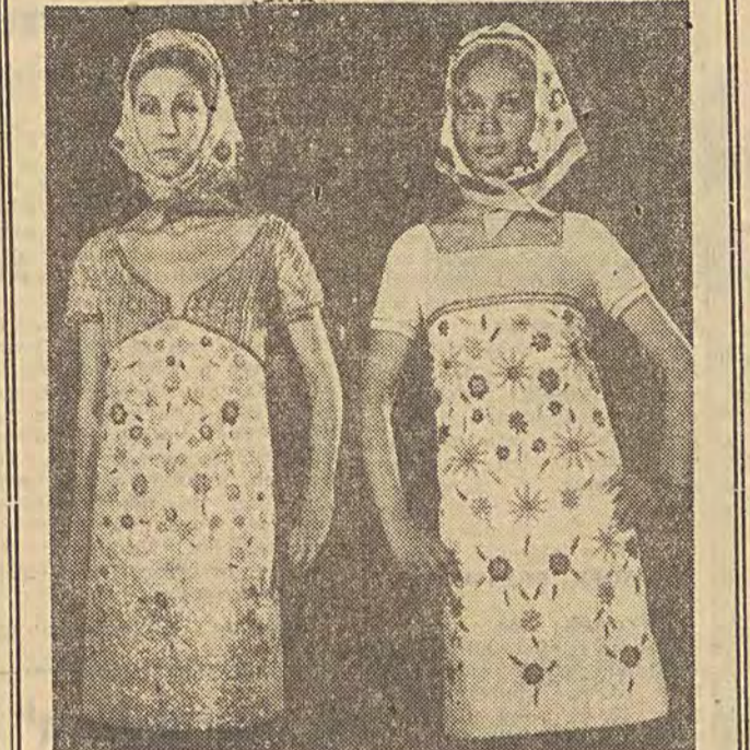
Włoski projektant mody damskiej, Renato Balestra, zaprezentował ostatnio pełny zestaw kolekcji jesiennie-zimowej. Wśród wielu kreacji powiaryają się sukienki i płaszczyki, będące dalekim echem folkloru i stylu „wielkiego”. Podkreślają to szczególnie wzory na materiałach, przeważnie kwiecistych. Uzupełnieniem wielu modeli są również także akcesoria ludowe — jak chusteczki, serduszki i fartuszki, noszone nawet do sukienki wieczorowych.