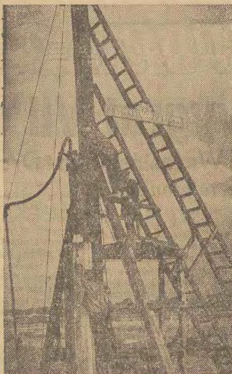
Kafar parowy, który zabija w dno rzeki długie zbrojne żelazem pale. W ten sposób powstaje ścianka wodoszczelna.

Ścianka wodoszczelna to jak by fundament powstającego jazu, który w przyszłości spiętrzy wodę na tym odcinku rzeki. Chodzi o to, żeby woda nie przeciekała gruntem.