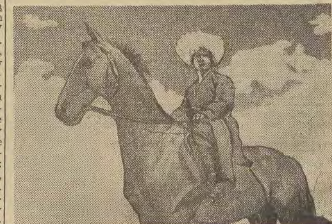
Sport konny jest jednym z najpopularniejszych sportów regionalnych w Republice Gruzjańskiej.

przez drużynę koźlecia ze środka boiska i przewiezieniu go w określone miejsce. Dru-