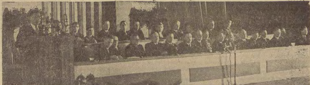
Dnia 6 listopada 1952 r. w Halli Mirowskiej w Warszawie odbyła się uroczysta akademie w XXXV rocznicę Wielkiej Socjalistycznej Rewolucji Październikowej, zorganizowana przez Komitet Centralny Polskiej Zjednoczonej Partii Robotniczej. Na zdjęciu: prezydium — przemawia sekretarz KC PZPR, wicepremier Aleksander Zawadzki.