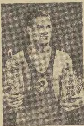
MIKOŁAJ BIEŁOW - czelowy zapaśnik radziecki, zdobywca brązowego medalu w wadze średniej, styl grecko-rzymski.

i wskazówek, zapoznają naszych trenerów z najnowszymi wzorami treningów i najlepszymi metodami szkolenia.