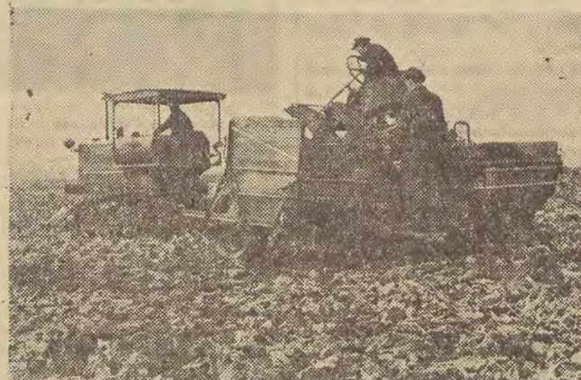
Niesprzyjające warunki atmosferyczne, panujące podczas tegorocznej kampanii wykopkowej, w dużym stopniu utrudniają pracę buraków cukrowych. W pracach tych wiele ułatwień przyniosą kombajny buraczane, dostarczone przez Związek Radziecki.