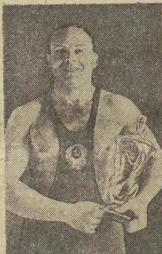
JAN KOTKAS - zapaśniczy mistrz olimpijski wsiach wag w stylu grecko-rzymskim.

Należy przypuszczać, że w najbliższym czasie przybędzie