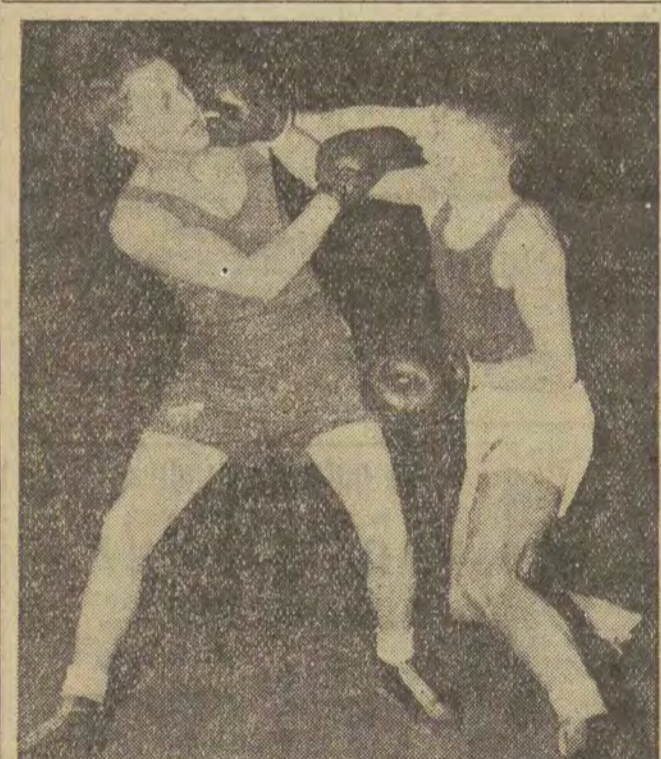
W Warszawie rozegrany został ostatni mecz bokserski o mistrzostwo I Ligi między Gwardią (W-wa) a Kolejarką z Gdańska...