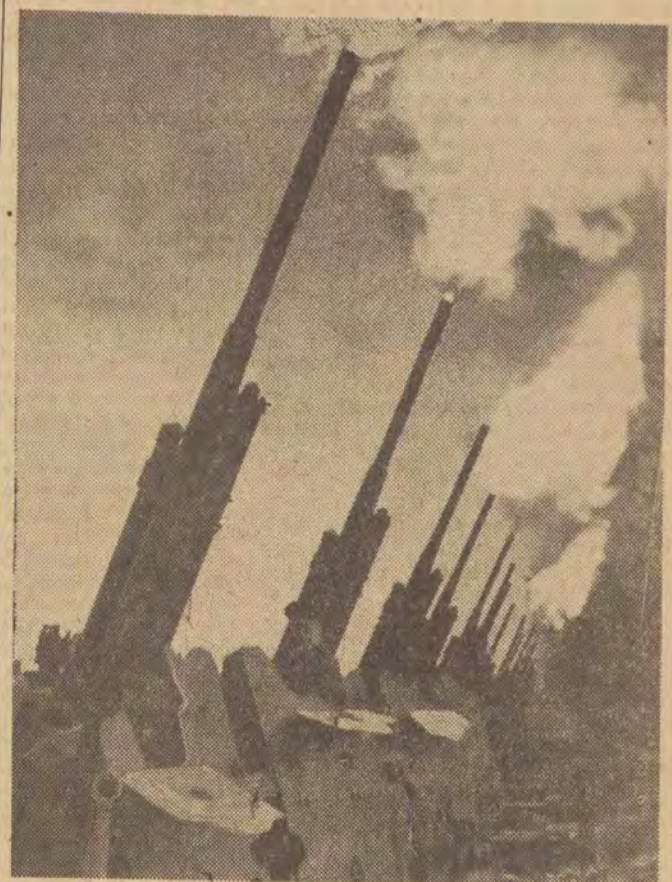
Warszawa 9 marca 1953 r. godzina 18. Salutem artyleryjskim żegna Wojsko Polskie Józefa Stalina.