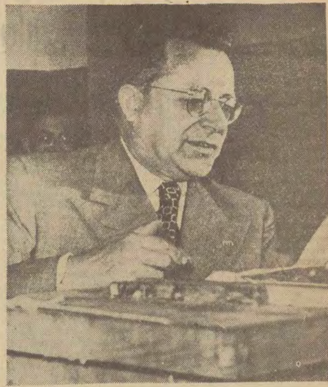
Palmiro Togliatti, sekretarz generalny Komunistycznej Partii Włoch.