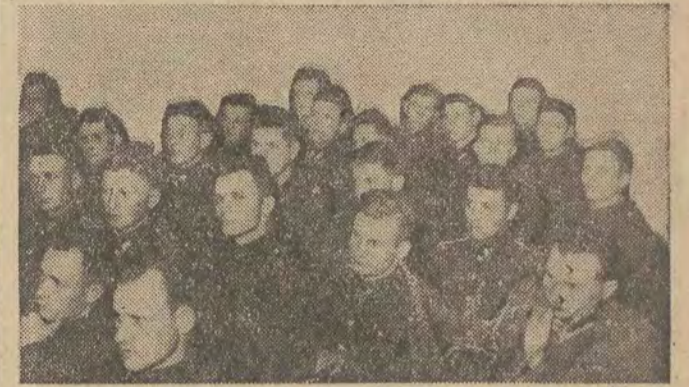
Podchorążowie uważnie słuchają słów dyskutantów