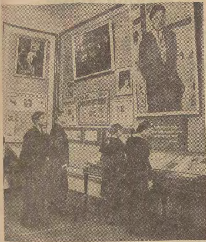
Dzisiaj przypada 23 rocznica śmierci Włodzimierza Majakowskiego, znakomitego poety radzieckiego, którego dzieła znane są całej postępowej ludzkości. W Moskwie w Państwowym Muzeum Literatury otwarto niedawno galerię, w której m. in. znajduje się sala poświęcona twórczości Majakowskiego. Na zdjęciu: zwiedzający muzeum oglądają eksponaty związane z życiem i twórczością Majakowskiego.