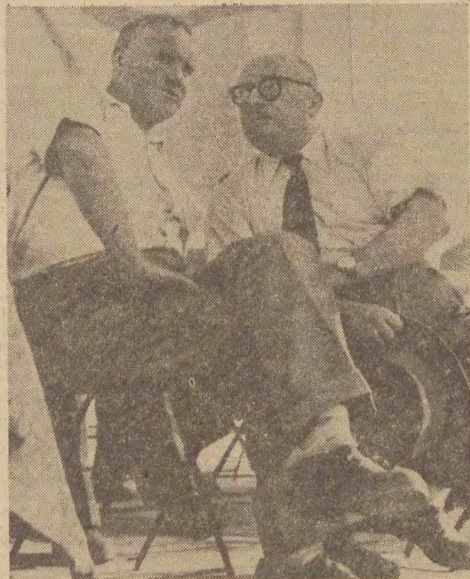
Na zdjęciu: Maurice Thorez i Jacques Duclos w 1950 r. w czasie święta „L'Humanite“ — w czasie święta „L'Humanite“ organu KC Francuskiej Partii Komunistycznej