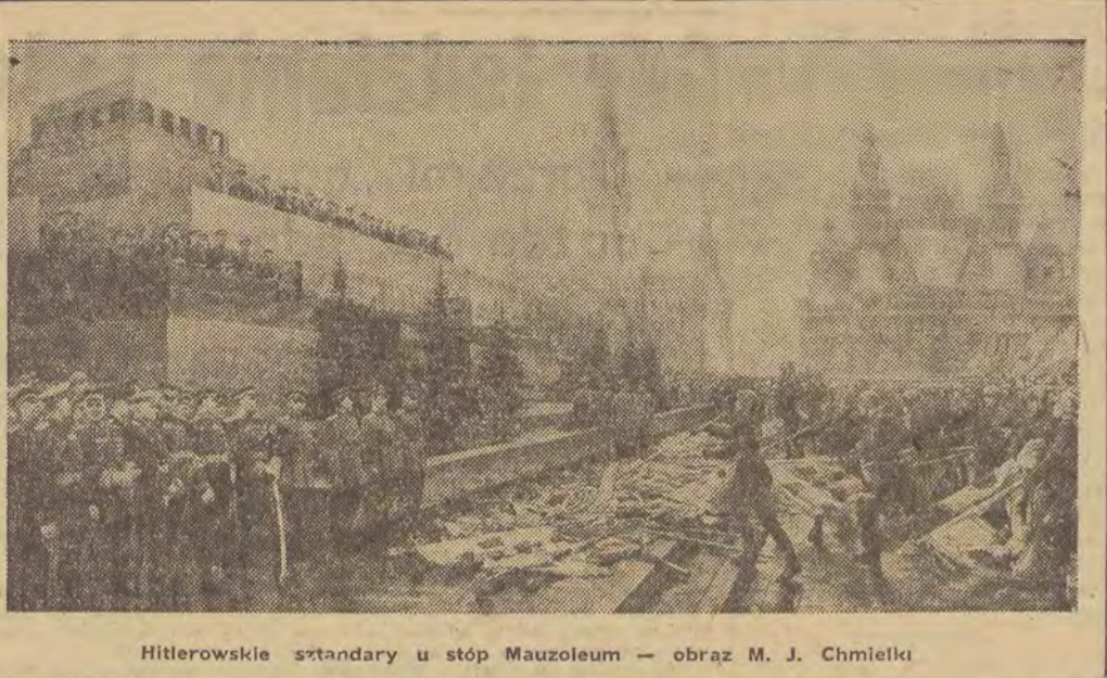
Hitlerowskie sztandary u stóp Mauzoleum — obraz M. J. Chmielki