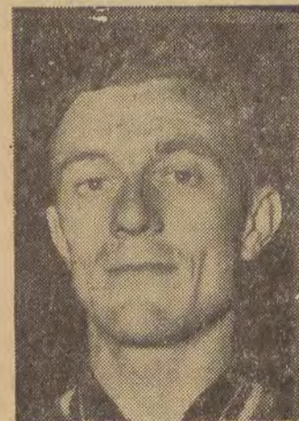
VAN SCHIL (Belgia)

W święcie sportowym czterech szkół w punktacji ogólnej zwyciężyli uczniowie V TPD — 268 pkt. przed IV TPD — 266 pkt., IX TPD — 238 pkt., I Liceum Ped. — 212 pkt. Na wyróżnienie zasługuje wykonanie skoku w dal M-deja — 6.18.