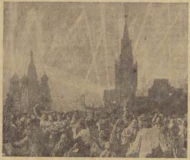
Obraz B. W. Johansona „Święto Zwycięstwa”

nin w przemówieniu na XIX Zjeździe Partii — nie wolno pominąć faktu, że do wywalczenia tego zwycięstwa wniósł swój wkład obok Armii Radzieckiej, okryte chwałą Wojsko Polskie i Korpus Czechosłowacki, utworzone w czasie wojny na terytorium Związku Radzieckiego. Walcząc ramieniem przy ramieniu z wojskami radzieckimi przeciwko wspólnemu wrogowi, żołnierze jednostek polskich i czechosłowackich dowiedli czynem swej