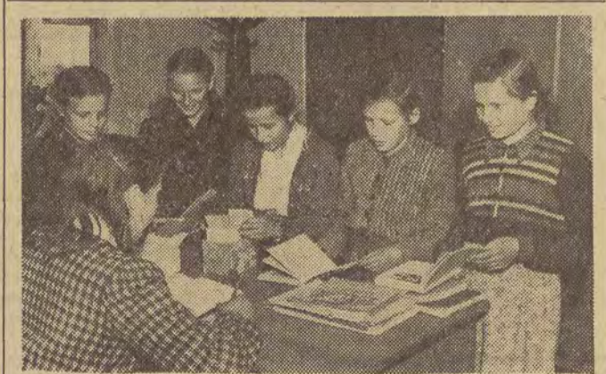
W 1952 r. ilość bibliotek w Polsce Ludowej wynosiła 85 tys. podczas gdy w 1938 r. było ich 35.411. Ilość książek będących do dyspozycji czytelników wynosi obecnie ponad 55 milionów tomów.