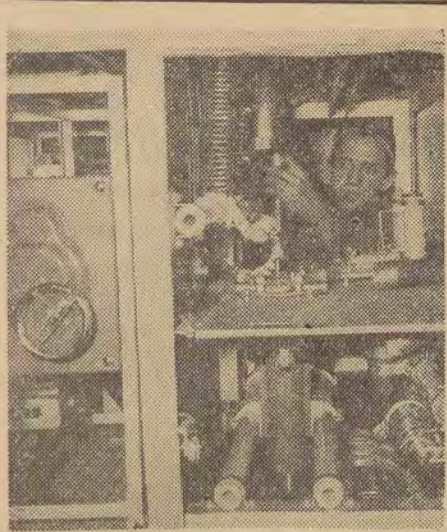
Jeden z największych w Europie...

Jeszcze w bieżącym roku w Instytucie Badań Jądrowych w Bronowicach pod Krakowem oddany zostanie do użytku u-