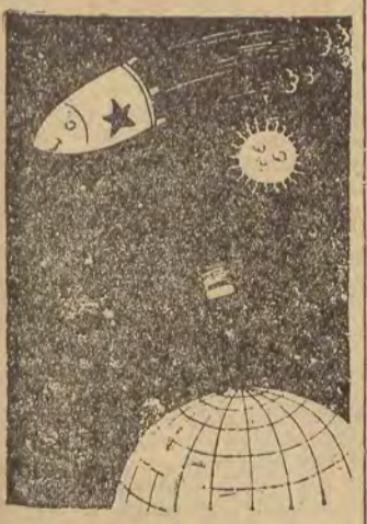
Sputnik do „Explorera”. — Widzisz, mały, gdybyśmy współpracowali, mógłbyś być większy!

Organa milicyjne przypuszczają, że mogła to być większa ilość kalichloridu co do robenia petard na Wielkanoc. Dochodzenie w toku.