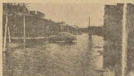
Ulice 1 Maja, Kopernika, Krasińskiego, Słowackiego, które najbardziej ucierpiały od powodzi przedstawiają smutny widok.

Jak już donosiliśmy, Kutno nawiedziła powódź. Wody rzeki Ochni, których stan alarmowy sięgał 2,02 m, zalaly ulice miasta. Na peryferiach miasta woda dochodziła do pół metra.