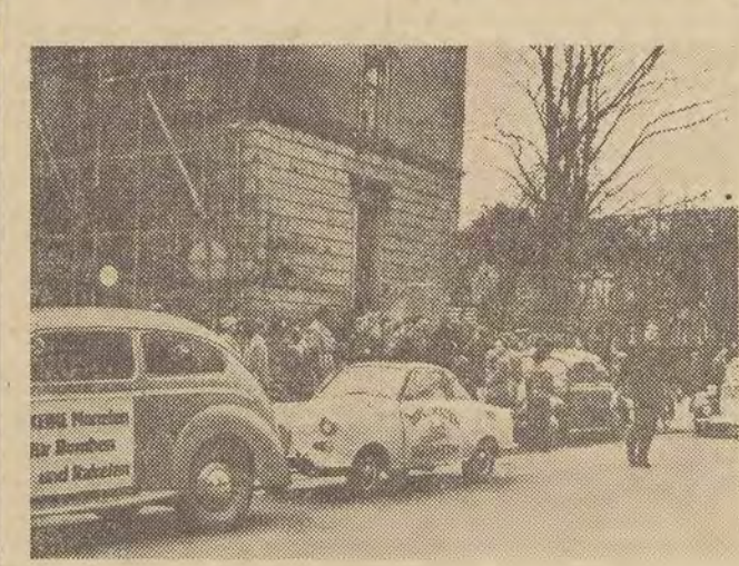
W Münster (NRF) odbyła się demonstracja przeciwko bazom rakietowym w NRF oraz wyposażeniu Bundeswehry w broń atomową. Demonstranci jechali samochodami, na których umieszczono napisy: „Żadnych pieniędzy na bomby i rakiety”, „Dyploma zamiast żołnierzy”.