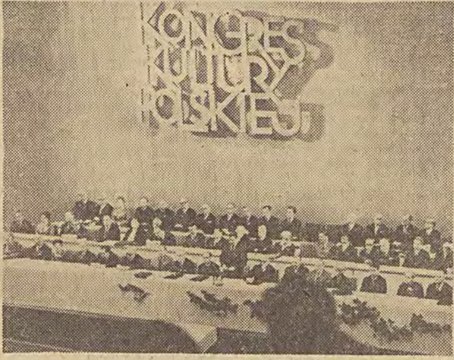
Na zdjęciu: ogólny widok prezydium kongresu.

Oznajmił również, że powoła na ostatnio Rada Kultury i Sztuki odbędzie swe pierwsze posiedzenie po kongresie, w listopadzie br., aby od początku swego działania wykorzystywać w pełni uchwały kongresu.