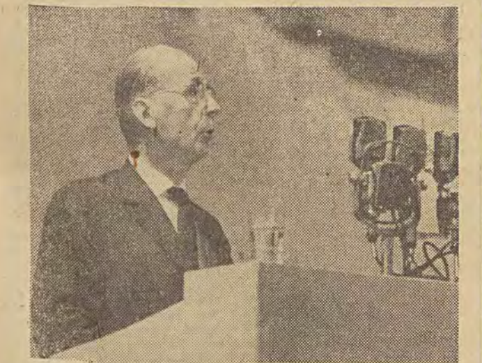
TOWARZYSZE I OBYWATELE! SZANOWNI ZEBRANI!

W imieniu Komitetu Centralnego Polskiej Zjednoczonej Partii Robotniczej oraz wszystkich stronnictw politycznych, w imieniu Frontu Jedności Narodu mam zaszczyt powitać Kongres Kultury Polskiej zwołany z okazji obchodów Tysiąclecia Państwa Polskiego.