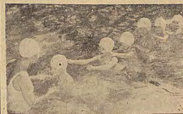
Na basenie III TPD rozpoczął się „sezon pływacki” przedszkolaków. Dzieci z pobliskich przedszkoli uczą się tu w godzinach przedpołudniowych pływać pod czujnym okiem wychowawczyń i instruktorów.