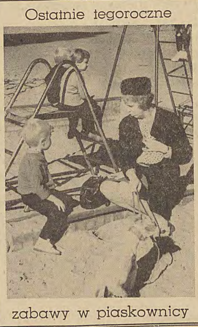
Ostatnie tegoroczne zabawy w piaskownicy

P. S. W ramach obchodów jubileuszowych „Dzień Strzelczyka”. Na tegorocznych Międzynarodowych Targach w Poznaniu był także specjalny strzelczykowski „Program z dywanikiem”. W dniach 24 i 25 bm. odbędzie się pełna referatów i komunikatów naukowych, tudzież gości z politechnik polskich, konferencja naukowo-techniczna pt. „Rozwój obronki cierniej wykańczającej”. 24 bm. nastąpi otwarcie wystawy osiągnięć technicznych zakładu. Obchody zakończą się 5.XI. uroczystą Konferencją Samorządu Robotniczego w sali Operetki Łódzkiej.