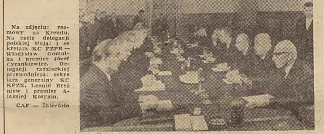
Na zdjęciu: rozmowy na Kremlu. Na czele delegacji polskiej stoi: I sekretarz KC PZPR — Władysław Gomuła i premier Józef Cyrankiewicz. Delegacji radzieckiej przewodniczą: sekretarz generalny KC KPZR, Leonid Breżniew i premier Aleksiej Kosygin.

Osoby, które były świadkami potrącenia, w dniu 13.8. br. na ul. Rudzkiej przy stawach, starszej kobiety przez samochód, proszone są o zgłoszenie się do KRDMO, ul. Władysława Bytomskiej 60, pokój 18.