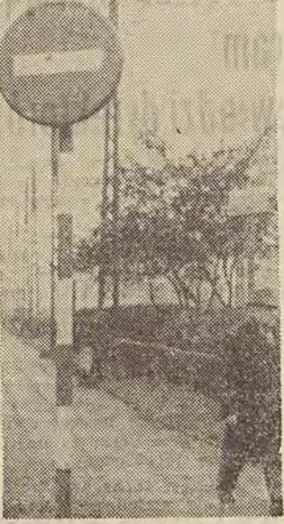
Na Placu Niepodległości świetlny znak drogowy.

chronne dzięki czemu z chodnika nikt nie dostanie się prosto pod tramway. EPRI zobowiązało się również objąć patronat nad Bałuckim Ryńkiem gdzie ustawi 10 świetlnych znaków drogowych. Nie trzeba chyba do-