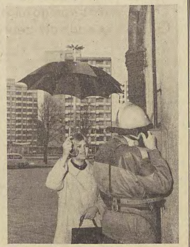
Strażacy zawsze cieszyli się powrotem wśród płci pięknej. Nawet w czasie deszczu mogą liczyć na uśmiech i... parasolkę.