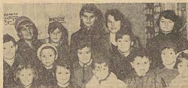
Na zdjęciu: Kolo TPL przy Szkole Podst. nr 62