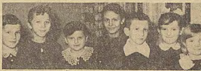
Delegacja Szkoły Podst. nr 164.