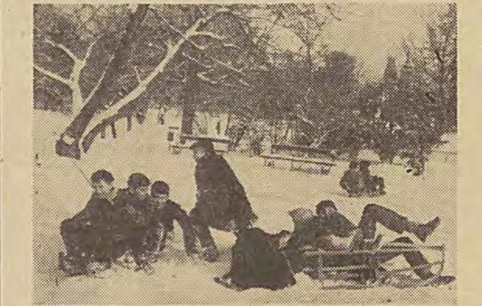
Hustawka pogodowa w naszym kraju nie denerwuje i nie martwi jedynie dzieci. Kiedy po odwilży spadł śnieg korzystają one chętnie z zimowych rozrywek.