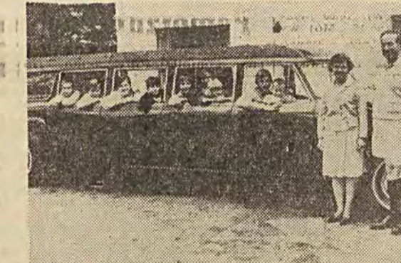
Państwo Heidkamp (USA), rodzice aż jedenaścioro dzieci rozstrzygnęli kłopot rodzinny „transportu” przy pomocy osobowego samochodu o pojemności średniego mikrobusu. Samochód ich ma prawie 6,5 metra długości, a wykonany został na specjalne zamówienie ojca rodziny przez jedną z fabryk. Na zdjęciu: państwo Heidkamp przed wyjazdem na weekend.