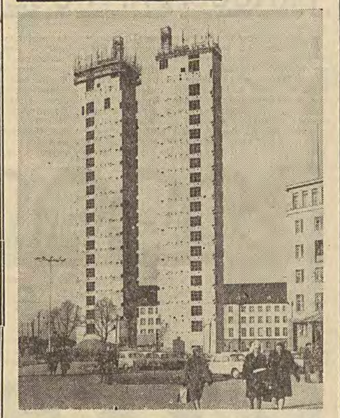
Nowym akcentem w budownictwie Gdańska będzie piękna sylwetka nowego gmachu Centralnego Biura Konstrukcji Okrętowej — w skrócie CBKO.

cja władz nie było skomplikowane życia uczniom i dyrekcji szkoły, ale ustalenie takiego stanu, który by z jednej strony gwarantował właściwe szkolenie kadr pielęgniarów, a z drugiej przy minimalnych nakładach finansowych mógł zabezpieczyć najpilniejsze potrzeby w zakresie opieki społecznej.