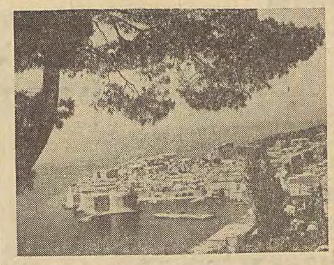
Panorama Dubrownika, położonego nad brzegiem Adriatyku w Dalmacji. W mieście tym do atrakcji turystycznych należą zabytkowe budowle i mury obronne z czasów sławnej republiki dubrownickiej, która przetrwała od XII wieku aż do początków XIX w.