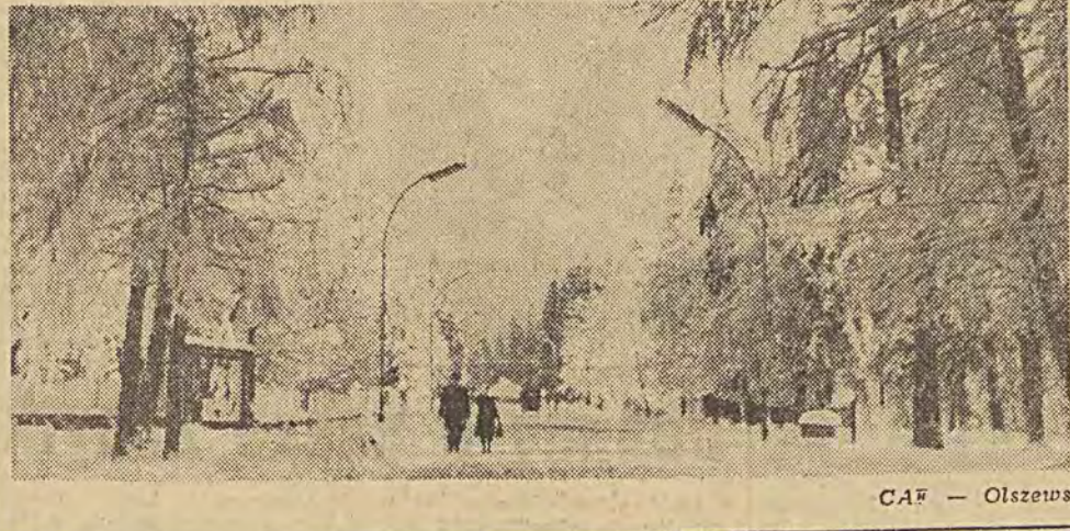
CAF — Olszewski