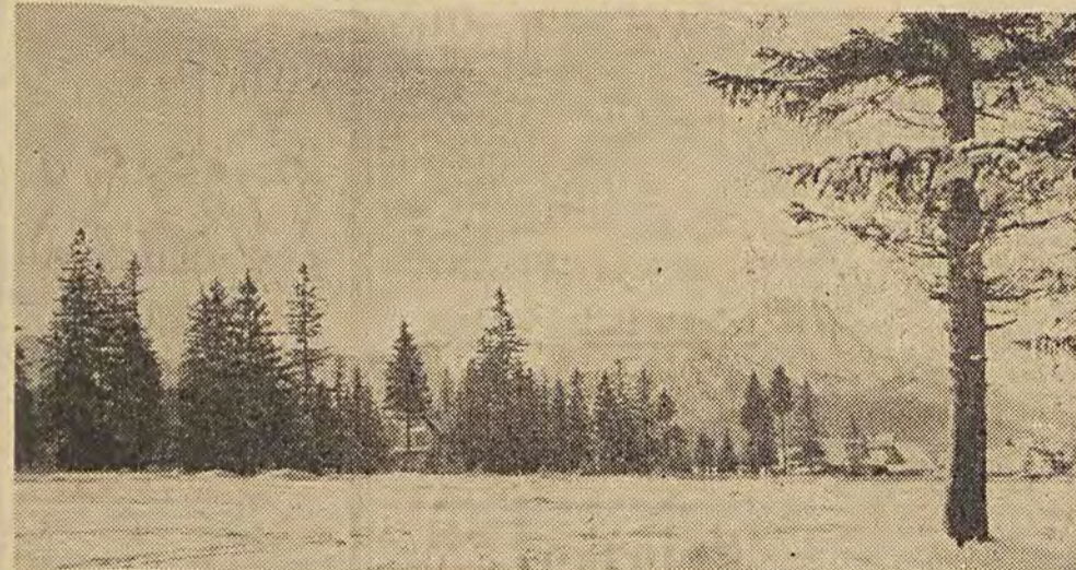
W Zakopanem panuje nareszcie piękna, prawdziwa zima. Na zdjęciu: Cyhrle. Widok na Giewont.