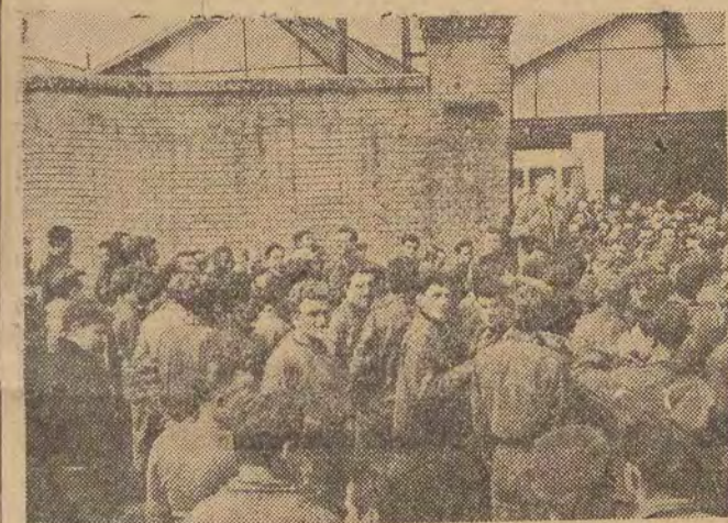
We Francji na terenie wielu fabryk odbyły się demonstracje protestacyjne przeciwko stosowaniu tortur wobec powstańców w Algerze. Na zdjęciu: wiec protestacyjny w zakładach Chausson w Gennevilliers.