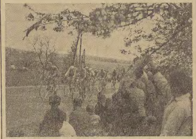
Czołowa grupa kolarzy na trasie III etapu Tabor — Praga.

Dużycy i Szwedzi, aby utrzymać w skostniałych rękach obciążone kierownice, okrywali je swoimi krótkimi nielerynkami i tak podawali do mety.