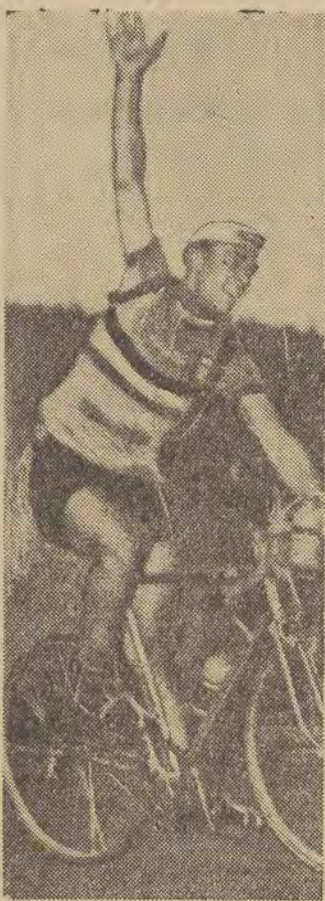
Zwycięzca V etapu Belg Proost.