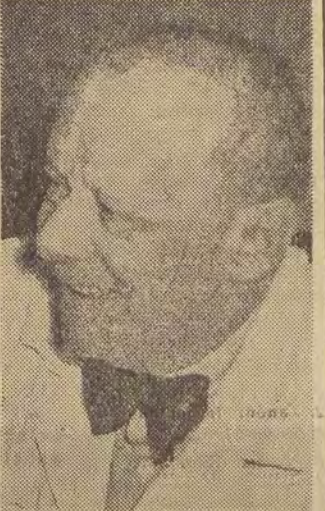
najdłużej pracować w swoim zawodzie.