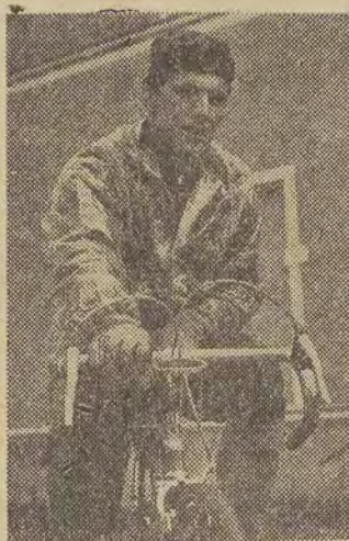
Na najcięższym piątym etapie najlepiej z Polaków jechał Pruski i był na metce 10-ty.

stał Belg Proost 3.48.29 przed Schurem NRD 3.49.13 i Van Tongerloo Belgia 3.49.43. Drużynowo etap wygrała Francja przed NRD i ZSRR.