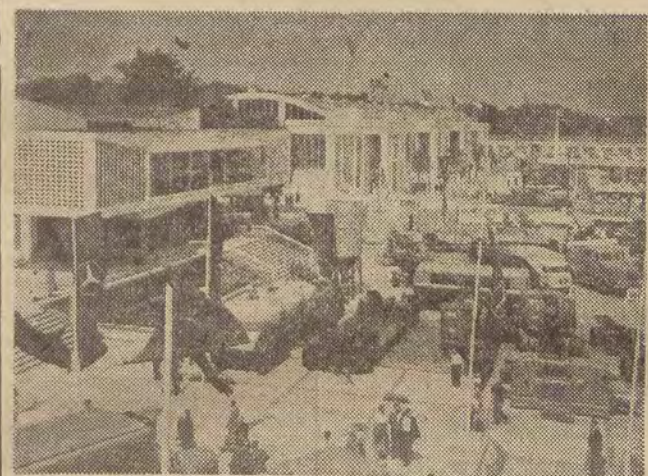
Na zdjęciu: ogólny widok terenów targowych.