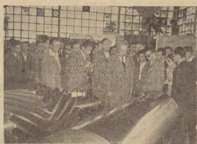
Na zdjęciu: premier Cyrankiewicz w polskim pawilonie hutnictwa.

LONDYN (PAP). — Wybory powszechne, które miały się w tym miesiącu odbyć w Sudanie, zostały odłożone do lutego 1958 r.