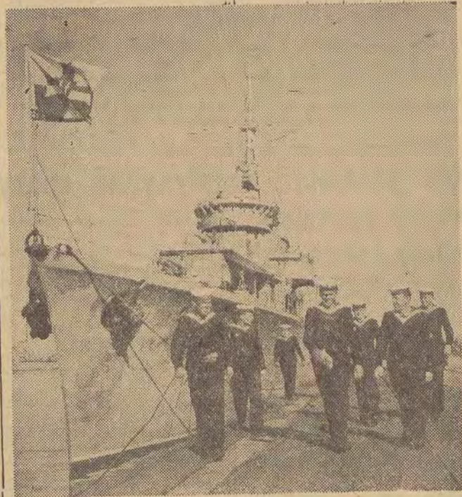
CAF — fot. Uklejewski