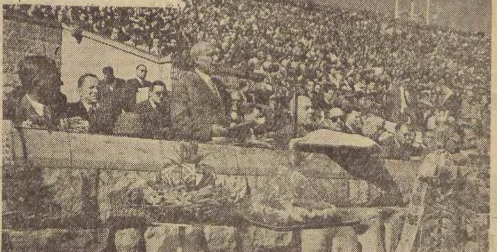
Fragm. trybuny honorowej. Przemawia Władysław Gomułka.

Obecnie 500 km wybrzeża polskiego posiada obszerne zaplecze — Polskę szybko rozwijającą się i nawiązującą najszerze kontakty gospodarcze ze światem — aż do Dalekiego Wschodu (Dalszy ciąg na str. 2)