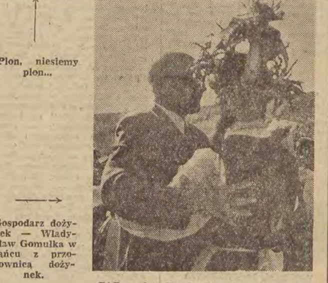
Gospodarz dożynek — Władysław Gomułka w tańcu z przewodniczącą dożynek.