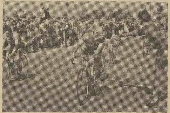
Na zdjęciu: kolarze przejeżdżają wśród niezliczonych tłumów widzów, chętnie korzystają z wody, by w czasie panującego upału i żarzącej walki orzeźwić się.

Chcielibyśmy w przyszłości widzieć sędziów lepiej przygotowanych do swej pracy, co niewątpliwie wpłynie w dużej mierze na poziom organizacji imprez kolarskich tak w Helenowie jak i na szosach. (n)