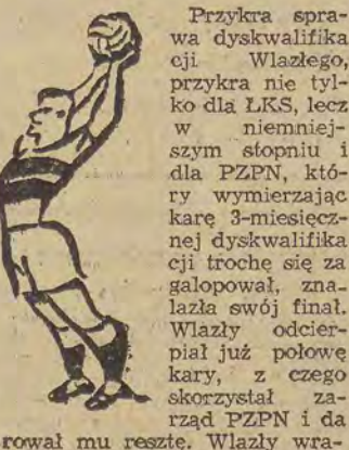
rował mu resztę. Wlazły wra-

Reprezentacja Polski wyłoniona zostanie spośród nastę-