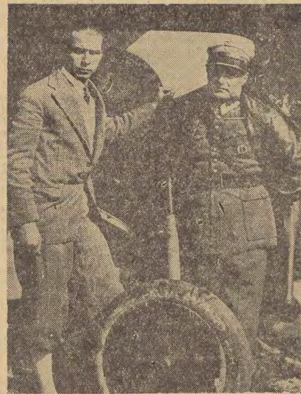
28 sierpnia 1932 r. polscy lotnicy kpt. Franciszek Żwirko i inż. Stanisław Wigura na samolocie polskiej konstrukcji RWD-6, odnieśli w Berlinie wspaniałe zwycięstwo w Międzynarodowych Zawodach Samolotów Turystycznych.

Kilkanaście dni po pamiętnym zwycięstwie świat obiegła tragiczna wieść. Bohaterowie Berlińskiego Challenge'u — Żwirko i Wigura zginęli w katastrofie lotniczej. Katastrofa nastąpiła podczas burzy nad miejscowością Cierlicko w Czechosłowacji. Polscy lotnicy lecieli na samolocie polskiej konstrukcji RWD-9 do Pragi, na zaproszenie tamtejszego Aeroklubu. Było to 11 września 1932 r.