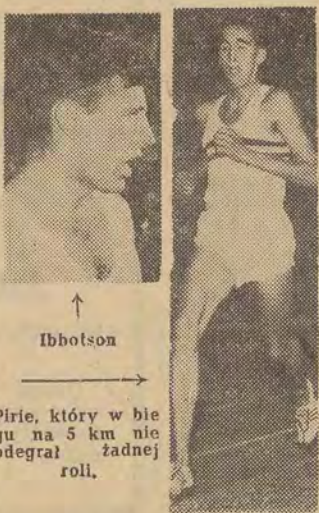
Pierś, którą w biegu na 5 km nie odegrał żadnej roli.

Poza oszczepem podwójne zwycięstwo Polacy odnieśli w skoku w dal. Wyniki Grabowskiego i Kropidłowskiego są na poziomie światowym. Grabowski osiągnął 7,70, a Kropidłowski niewiele gorszy bo 7,52 m. Anglicy zrewanżowali się nam w biegu na 110 ppl. Tutaj Bugala, jako trzeci, uzyskał czas 14,9, a młody Król 15,3. Trzecie podwójne zwycięstwo odnieśliśmy w skoku wzwyż, dzięki Skupnemu — 2 m i Lewandowskiemu. W biegu na 200 m Baranowski zajął drugie miejsce — 21,9, a więc o 0,2 sek. słabszym od zwycięzcy Shentona. Krzyszkowiak okazał się bezkonkurencyjny w biegu na 3 km z przeszkodami. Wynik 8,48,8 to jego rekord życiowy. Trzeci był Ziółkowski — 9,07.