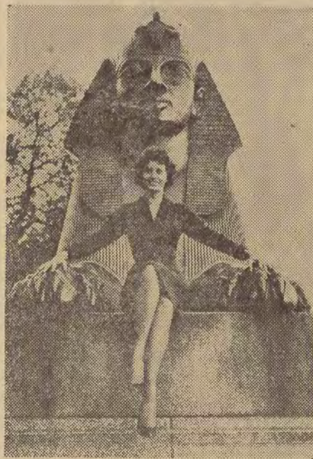
Sophia Loren przybyła do Londynu, gdzie William Holden realizować będzie jej udziałem film „The Key“ („Klucz“). Na zdjęciu: londyński sfinks niewątpliwie stanowi do godne pięknej Sophii...