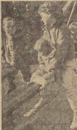
Chwila kontemplacji w słońcu nad stawem. Czy powtarzamy lekcje? Uczennice i uczniowie szkół łódzkich mają przymusowe ferie. Grypa ulokowała jednych w łózkach, a innym pozwala na korzystanie z uroków jesieni.