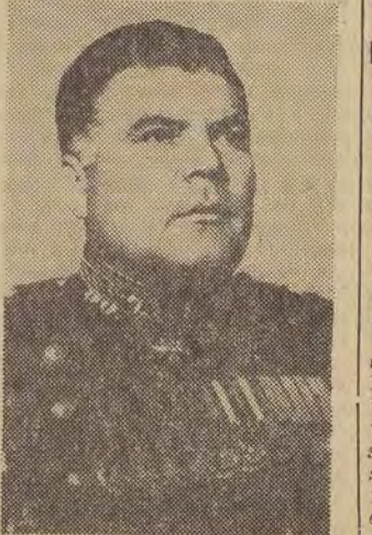
Minister obrony ZSRR — marszałek Związku Radzieckiego — R. J. Malinowski.

Dziennikarze zapytali także marszałka Bagramiana, czy wyjaśniona zostanie sprawa odwołania marszałka Żukowa z jego stanowiska — Bagramian odpowiedział: „Nie jest naszym zwyczajem pozostawiać ludzi w nieświadomości, wyjaśnienie takie zostanie wkrótce opublikowane”.