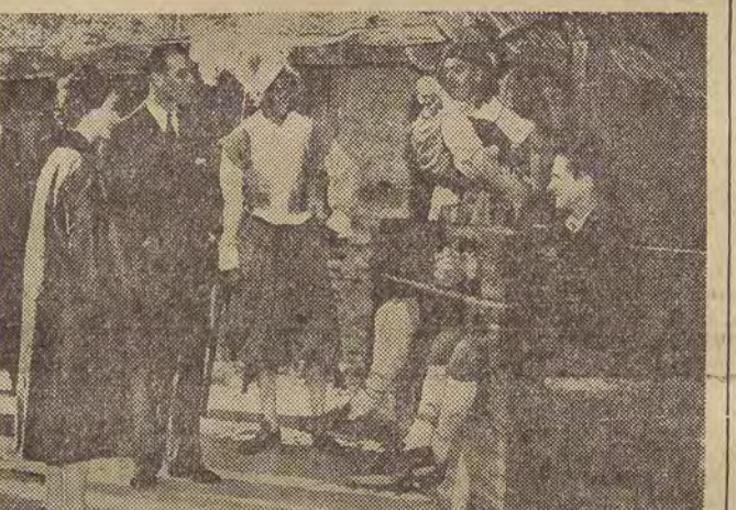
Z okazji 350-lecia swego istnienia miasto Jamestown w stanie Wirginia urządziło oryginalny pokaz... XVII-wiecznych tortur. Widzami byli m. in. królowa Wielkiej Brytanii — Elżbieta i jej mąż, przebywający w tym czasie w USA.