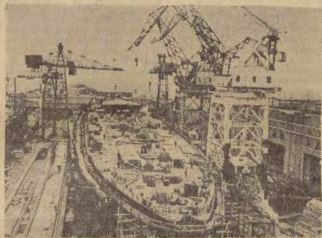
Tak wyglądała budowa lodolamacza. Na zdjęciu: „Lenin” — jeszcze nieukończony — w stoczni leningradzkiej.

Konstruktorzy radzieccy pracują również nad zastosowaniem energii atomowej w innych dziedzinach komunikacji, bynajmniej nie tylko morskiej.