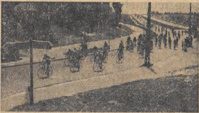
Warszawską autostradą kolarze przejeżdżają na start ostry.

VIII doroczny wyścig zgromadził na starcie 479 zawodników z całej Polski.