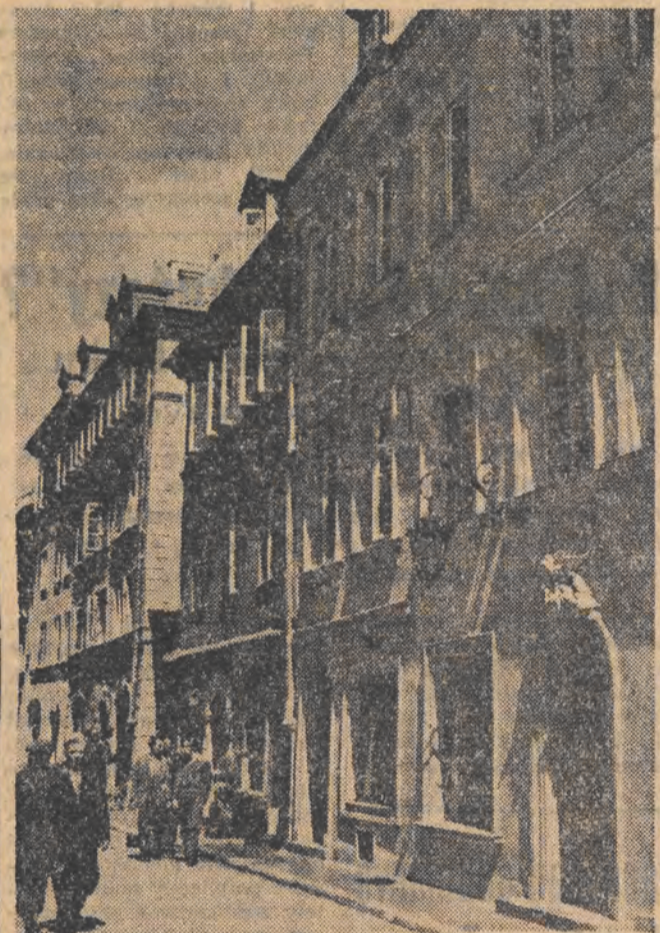
Budowniczo Traktu Starej Warszawy wykonali z honorem zobowiązania podjęte dla uczczenia Święta 22 Lipca. Dzięki ich wysiłkom Stare Miasto znowu tętni życiem. Na zdjęciu: fragment ulicy Piwnej