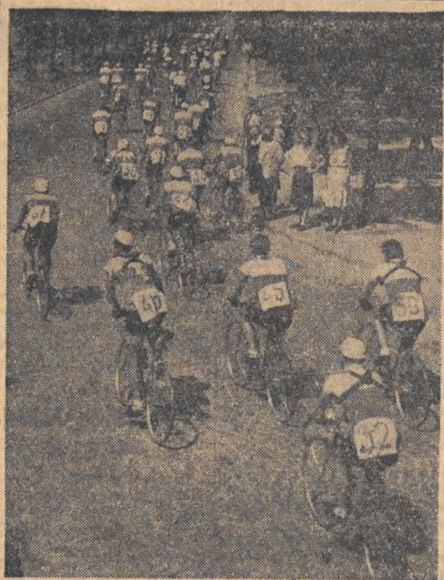
Zawodnicy wyścigu kolarskiego „Dziennika” i „Expressu” udają się na start.

PENG TEH-HUAI dowódca chińskich ochotników ludowych