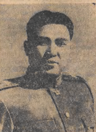
KIM IR SEN

Podpisanie porozumienia rozejmowego stanowi pierwszy krok w kierunku uregulowania w drodze pokojowej kwestii koreańskiej i jest dzięki temu wkładem w dzieło pokoju na Dalekim Wschodzie i na całym świecie. Zostało ono gorąco poparte przez narody koreański i chiński i przepełniło radością serca milujących pokój ludzi na całym świecie. Jednakże po stronie dowództwa wojsk NZ są jeszcze pewne wojownicze elementy, w szczególności klika Li Syn Mana, które są wielce niezadowolone z powodu dołączenia do skutku rozejmu w Korei i wobec tego przeciwstawiają się zdecydowanie podpisaniu porozumienia rozejmowego. Dla