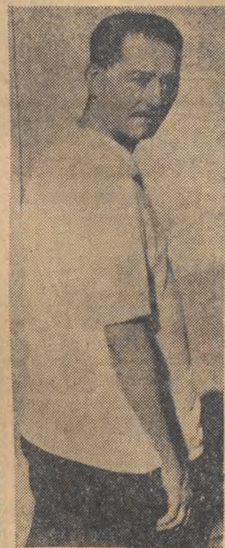
„W pewnym momencie dostrzegłem idącego ulicą Josefa Mengele...”