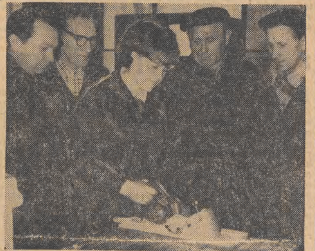
Pierwsze elektryczne ręczne strugarki ukazały się w sprzedaży w Łodzi. Są one importowane z NRD. Na zdjęciu: ekspedientka sklepu przy ul. Piotrkowskiej 150 demonstruje działanie struga. Jest on łatwy w użyciu i bardzo praktyczny.