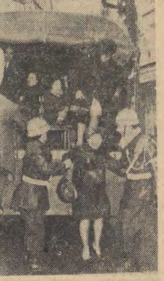
Na zdjęciu: w wyniku strajku powszechnego we Francji rolę komunikacji miejskiej przejął wojsko. Oto policjanci pomagają kobietom wysiąść z ciężarówki wojskowej, których wiele krajoznędą po ulicach Paryża dowożą mieszkańców do pracy.

O północy ze środy na czwartek we Francji zakończył się 24-godzinny strajk powszechny reklamowany przez trzy wielkie centrale związkowe: Powszechną Konfederację Pracy (CGT), Francuską Demokratyczną Konfederację Pracy (CFDT) oraz Krajową Federację Pracowników Oświaty (FEN). Przerwa 11 godzinę metalowcy, nauczyciele, pracownicy transportu miejskiego, elektrycy i gazownicy, pracownicy komunikacji lotniczej, poczty i wielu innych sektorów gospodarki francuskiej. W czwartek nadal strajko wali kolejarze, którzy przerwali pracę na 48 godzin we wtorek wieczorem. Prawie 2/3 komunikacji kolejowej zostało sparaliżowane.