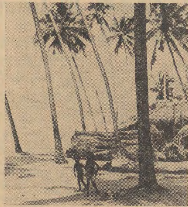
Na zdjęciu: krajobraz wybrzeża cejlońskiego CAF