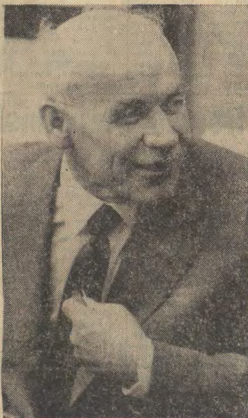
6 lutego Władysław Gomułka kończy 62 rok życia. Dostojnemu Jubilatowi, w dniu Jego urodzin, społeczeństwo polskie składa najserdeczniejsze życzenia dalszej owocnej pracy dla dobra Polski Ludowej, zdrowia i długich lat życia.