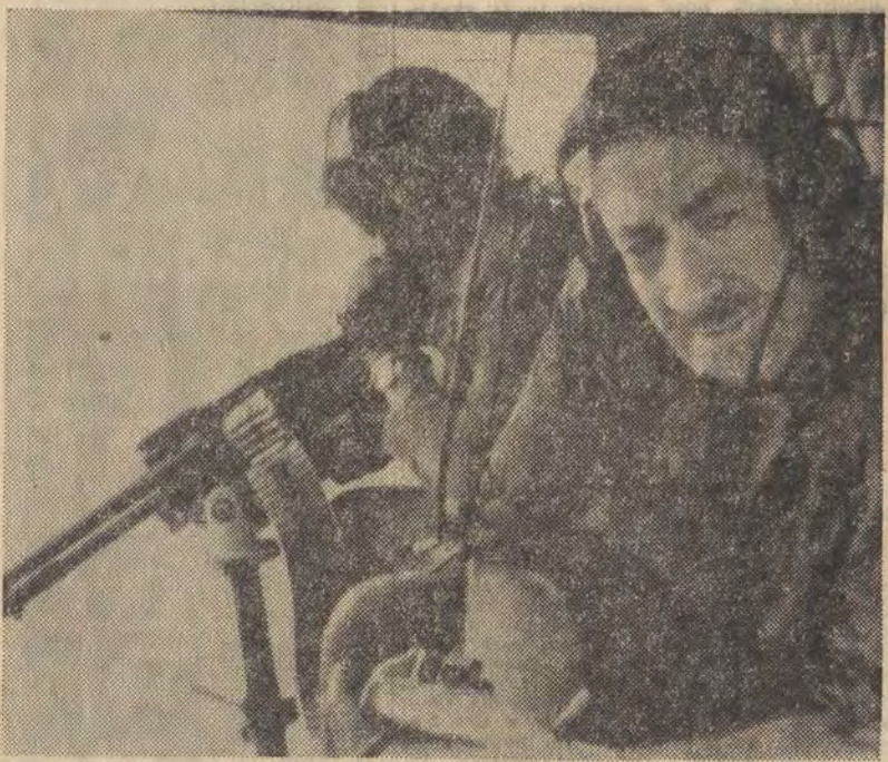
61-letni znany pisarz amerykański - laureat Nagrody Nobla - John Steinbeck rozpoczął pracę korespondenta wojennego w Wietnamie południowym.