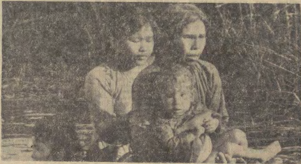
Na zdjęciu: kobiety i dzieci brną w wodzie kanału między polami ryżowymi w delcie Mekongu, uciekając z wioski ostrzelanej przez wojska rządowe.

To nie myśli się wówczas pomylili, to pan pomylił się teraz.