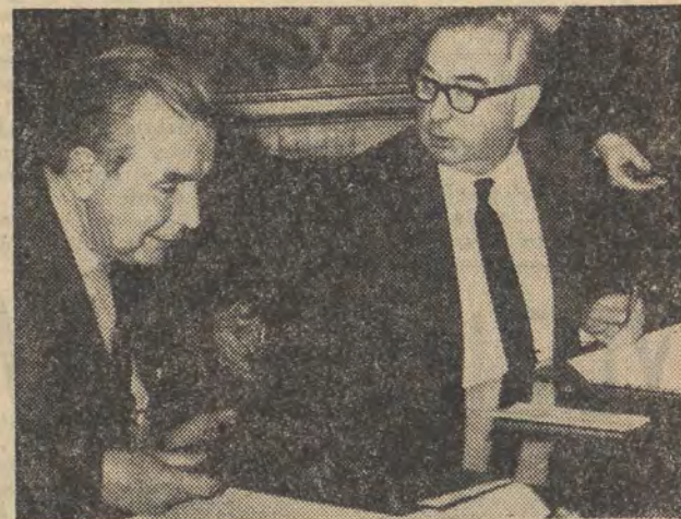
Na zdjęciu: w trakcie uroczystego podpisywania polsko-brytyjskiej umowy konsularnej (23 bm.) ministrowie spraw zagranicznych, Adam Rapacki (z lewej) i George Brown (z prawej) wymieniają między sobą teksty umowy.

Wczoraj w godzinach popołudniowych min. Rapacki był podejmowany lunchem przez premiera Wilsona w jego rezydencji na Downing Street 10. Podczas lunchu, który trwał dwie godziny, omawiano problemy międzynarodowe.