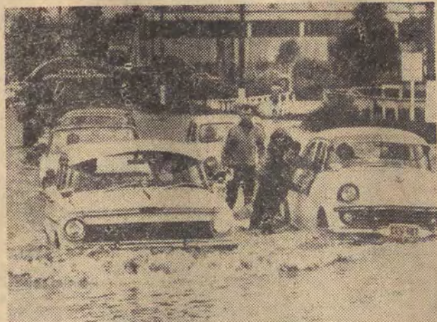
10 bm. spadł w Sydney deszcz tak ulewny, że ulice przemieniły się w rwące potoki — nie do przebycia dla samochodów i przechodniów. W kulminacyjnym momencie warstwa wody przekraczała ewentualnie metra! Na zdjęciu: jedna z ulic na przedmieściu Sydney — Rosehill.