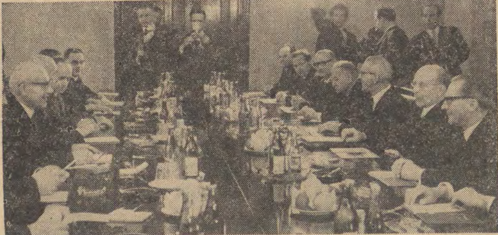
N/z: w czasie rozmów (z lewej) delegacja PRL, z prawej delegacja NRD.

UKŁAD — WYRAZEM GOTOWOŚCI OBRONY NASZEJ SUWERENNOŚCI, NIEPODLEGŁOŚCI I ZDOBYCZY SOCJALIZMU