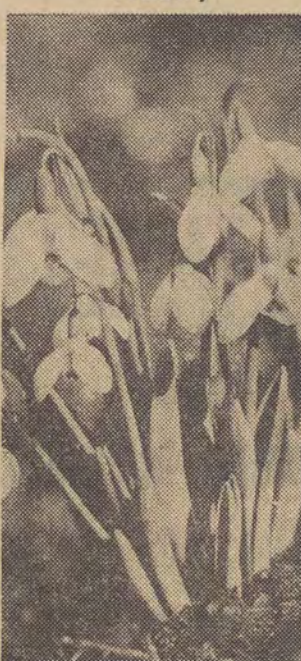
Snieżyczki, pierwsze kwiaty wiosny, zakwitły we Wrocławiu.