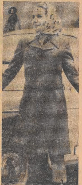
dzieje, że to rendez-vous projektantów modeli odzieży, producentów i handlowców przyznają się wreszcie do przelania impasu w zapotrzebowaniu na odzież dla nastolatków. (wit)