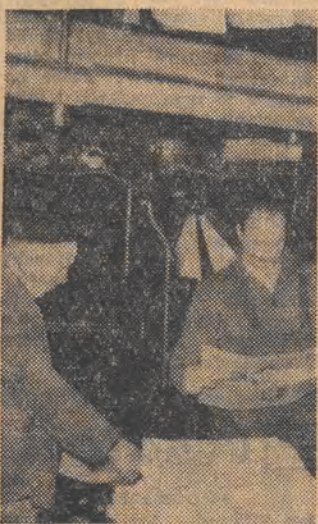
Z maszyn rotacyjnych schodzą pierwsze numery „Dziennika Łódzkiego“, pachnące jeszcze farbą