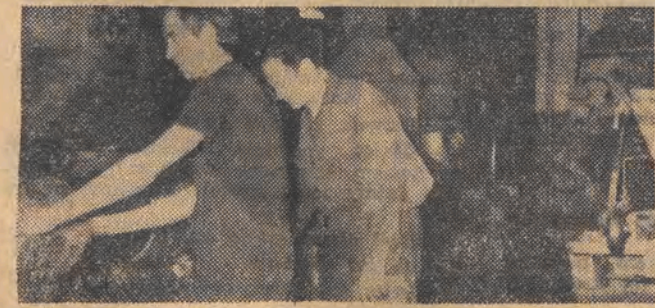
W odlewni pracownicy stereotypii odlewają w ołowiu kolumny.

Tu w tej długiej hali Zakładów Graficznych RSW