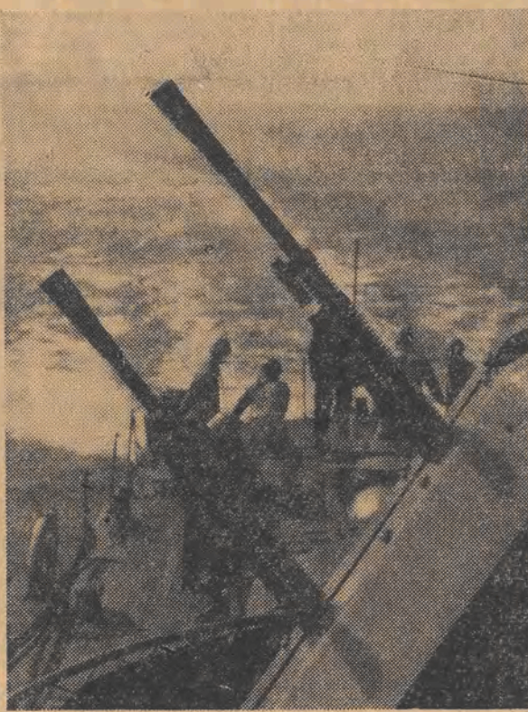
Na zdjęciu: okręt patrolowy Wojsk Ochrony Pogranicza podczas rejsu na naszych wodach terytorialnych.