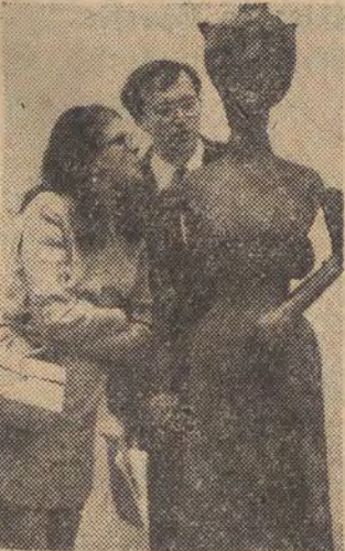
Sensacja artystyczna Londynu jest nadal otwarta przed kilkunastu dniami wystawa rzeźb Picassa. Jak wiadomo, jest to pierwsza wystawa wielkiego Hiszpana składająca się wyłącznie z jego rzeźb. Na zdjęciu: zwiedzający przed rzeźbą „Kobieta w długiej sukni”.