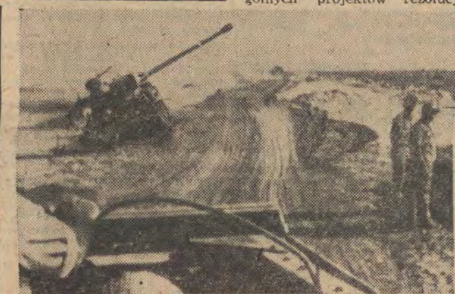
2 bm. wojska izraelskie dopuścili się nowych aktów agresji przeciwko krajom arabskim otwierając ogień na stanowiska egipskie w rejonie Ras el Ajis (wschodnia strona Kanalu Sueskiego). Atak agresora został odparty. Na zdjęciu: zniszczony czołg izraelski przy drodze, którą oddziały agresora wycofały się w kierunku El-Kantary.